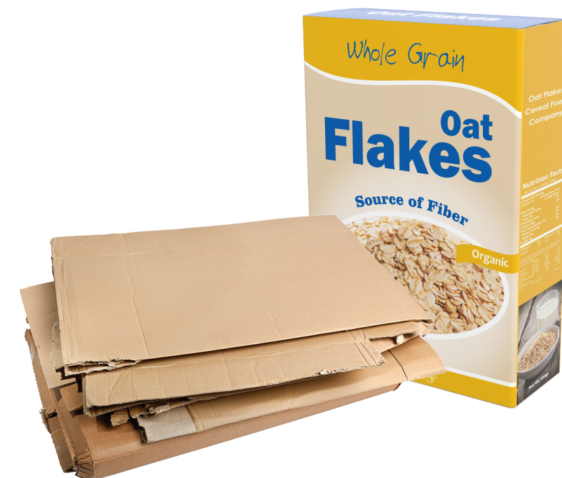
Cereal boxes and flattened cardboard