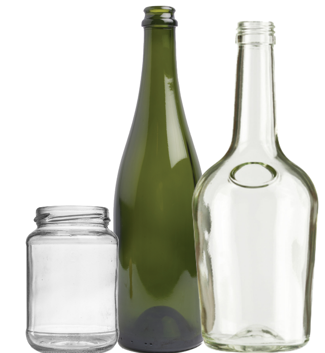
Bottles and jars