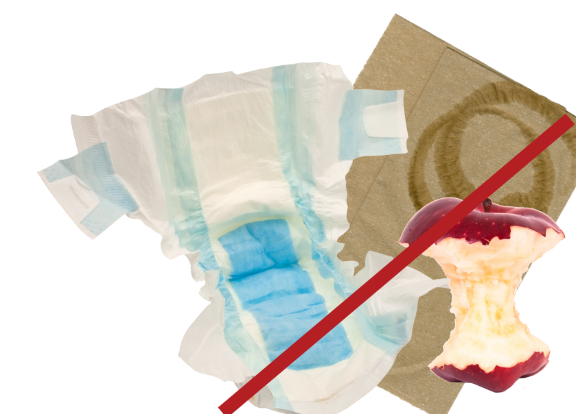
No household garbage