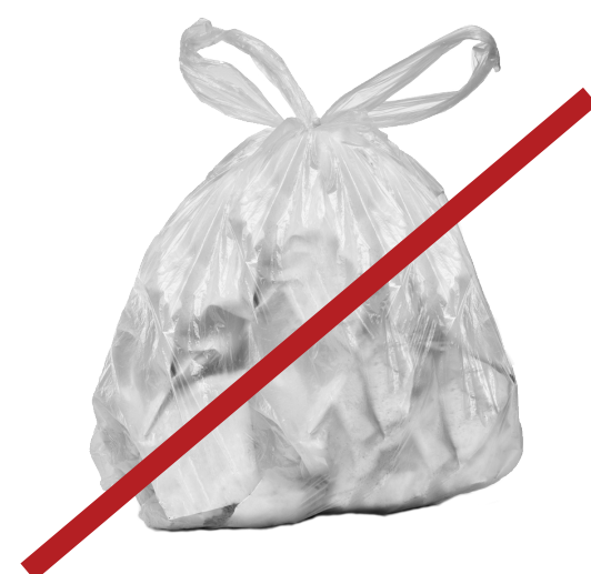
Don't bag recyclables

DO NOT place these items in your recycling container: NÃO coloque estes artigos em seu contentor de reciclagem: