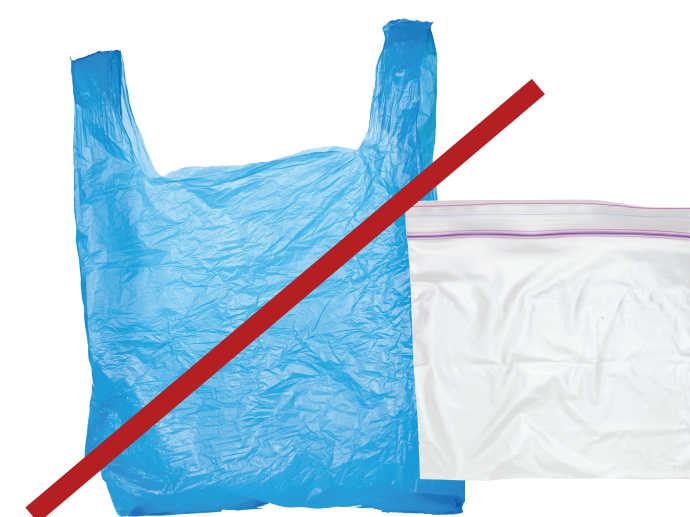
No plastic bags or plastic wrap

Nada de sacos plásticos ou películas de plástico