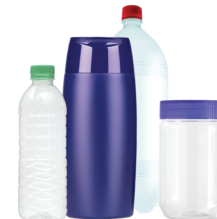
Kitchen, laundry, bath: Bottles and containers

Cozinha, lavanderia, banheiro: garrafas e recipientes