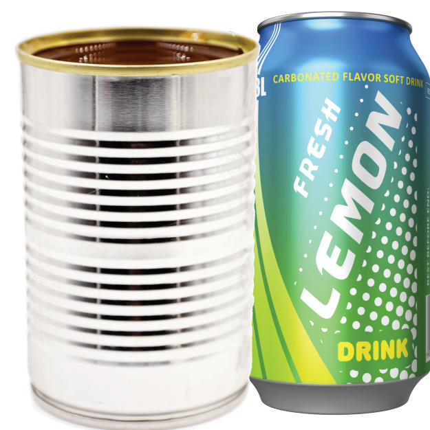
Aluminum and steel cans