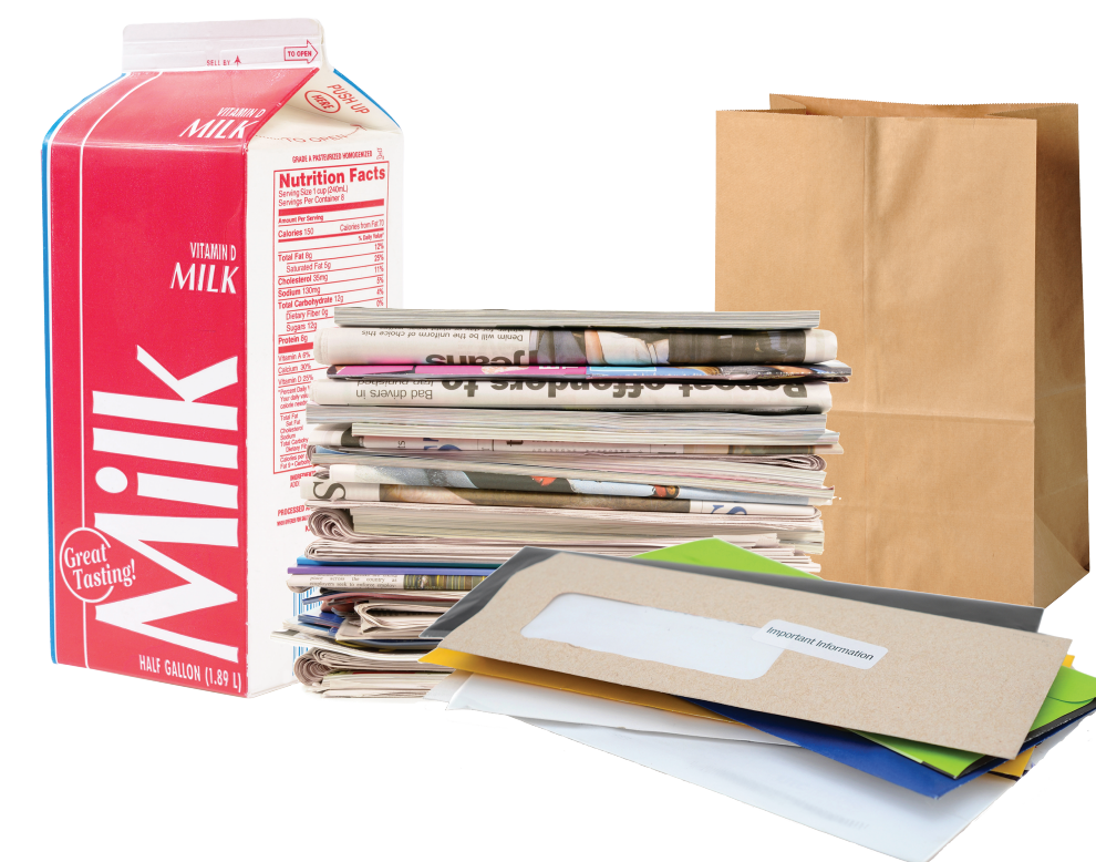
Food and beverage cartons, newspaper, magazines, mail

Caixas de alimentos e bebidas, jornais, revistas, correio